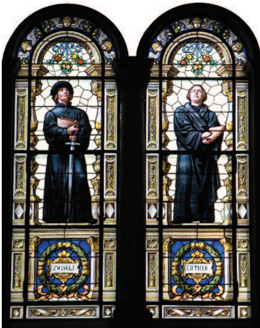
Zwingli és Luther