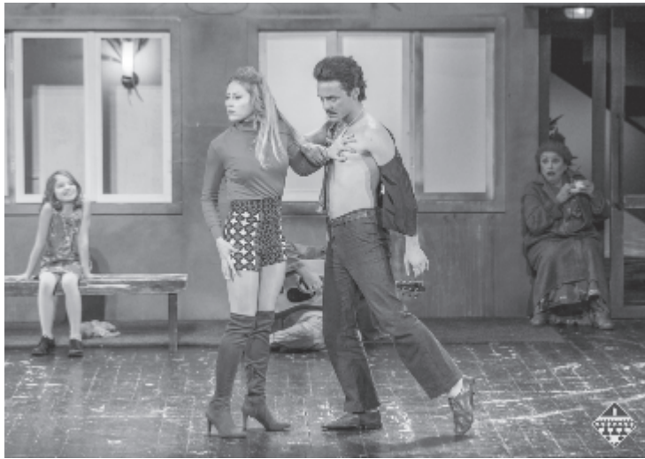
Retromadár blokknak csapódik, és forró aszfaltra zuhan

A XXV. kiadásához érkezett Uniter-gálát május 8-án tartják Temesváron a Mihai Eminescu Nemzeti Színházban. A 2017-es Uniter-gála további jelölései megtekinthetők a http://www.uniter.ro/nominalizari-le-pentru-premiile-galei-uniter-2017/#sthash.Bt1iGNx2.dpuf oldalon. (pr-titkarság)